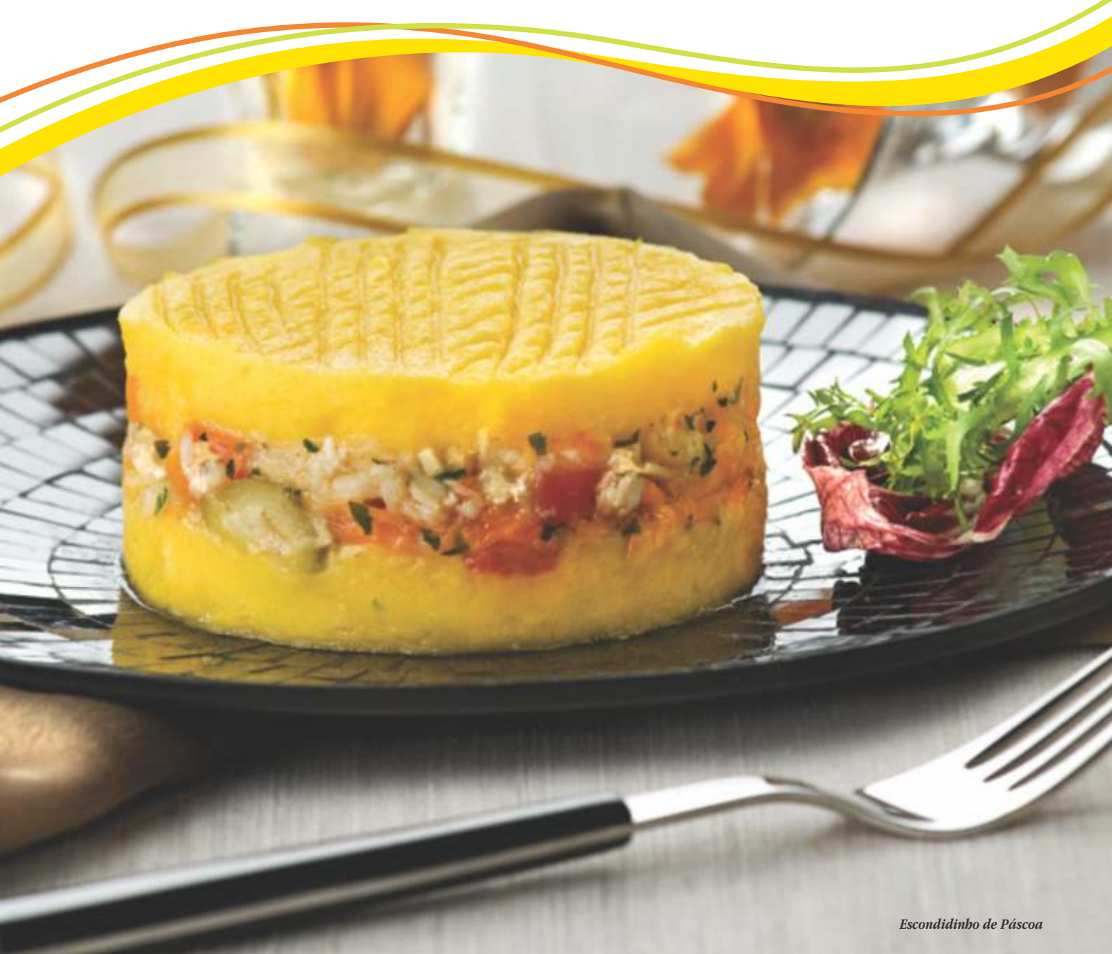
Escondidinho de Páscoa