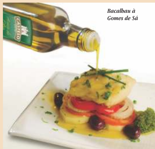
Bacalhau à Gomes de Sá

Tampe a panela e leve ao fogo brando, sacudindo a panela de vez em quando, por cerca de 30 minutos. Passe o