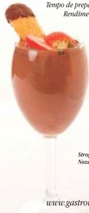
Strogonoff de Nozes e Chocolate