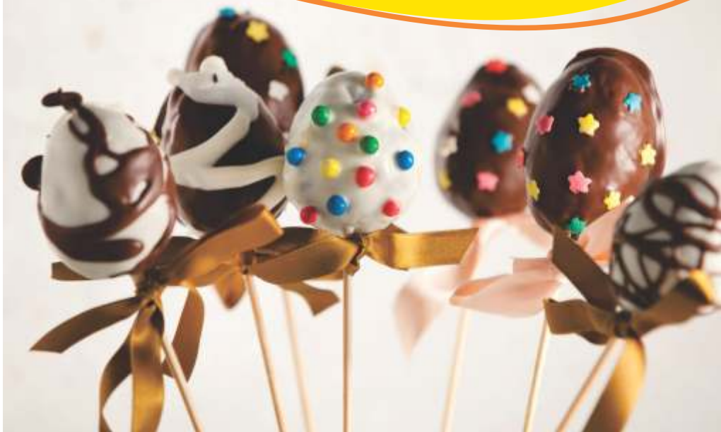
Ovos de Páscoa

Acesse www.gastrovia.com.br e fique por dentro das promoções e dicas Siga-nos no Twitter @Gastrovia