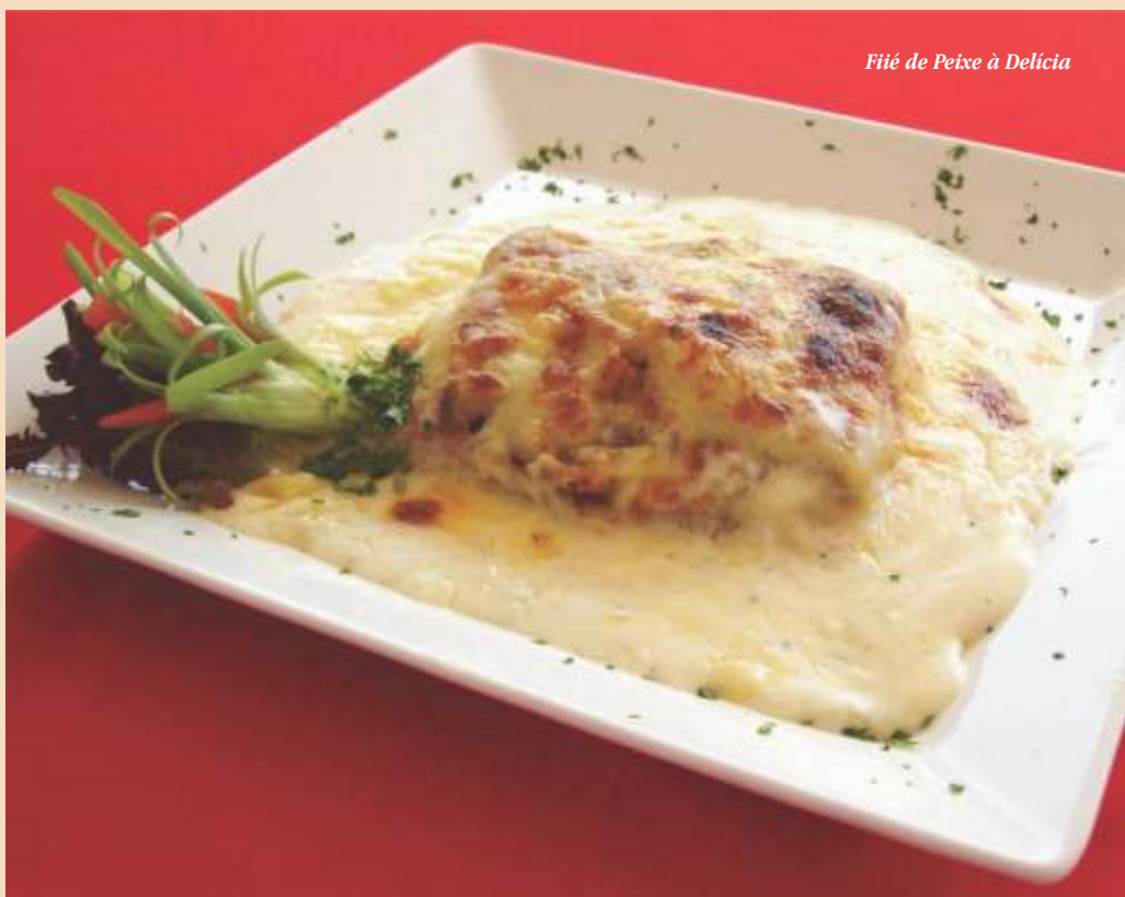
Filé de Peixe à Delícia

Tempere o peixe com o sal e a pimenta do reino. Passe o peixe pela farinha de trigo e o grelhe na chapa. Quando estiver grelhado, coloque o peixe num refratário que possa ir ao forno. Numa tigela, misture o creme de leite com o leite de coco e leve uma frigideira ao fogo para derreter a manteiga. Junte o suco de ½ limão, o creme de leite misturado com o leite de coco e deixe ferver em fogo baixo, mexendo sempre. Retire do fogo. Coloque as fatias de queijo mussarela