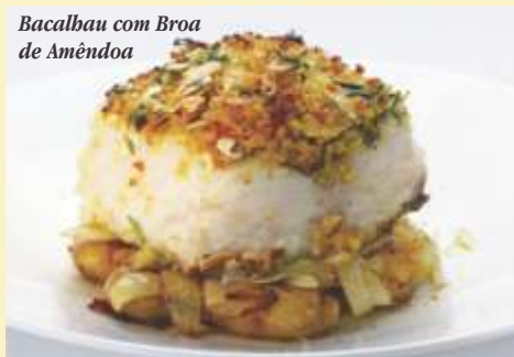
Bacalhau com Broa de Amêndoa

Rendimento: 4 pessoas Receita Bacalhau Dias