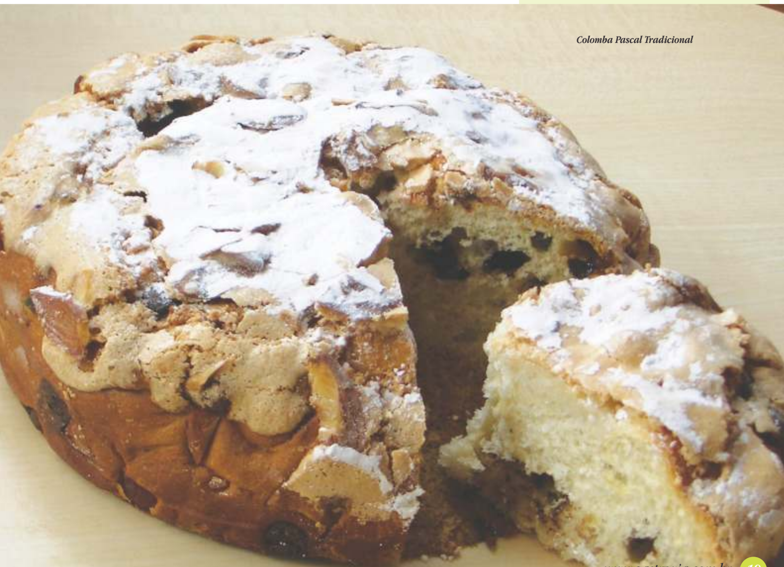
Colomba Pascal Tradicional