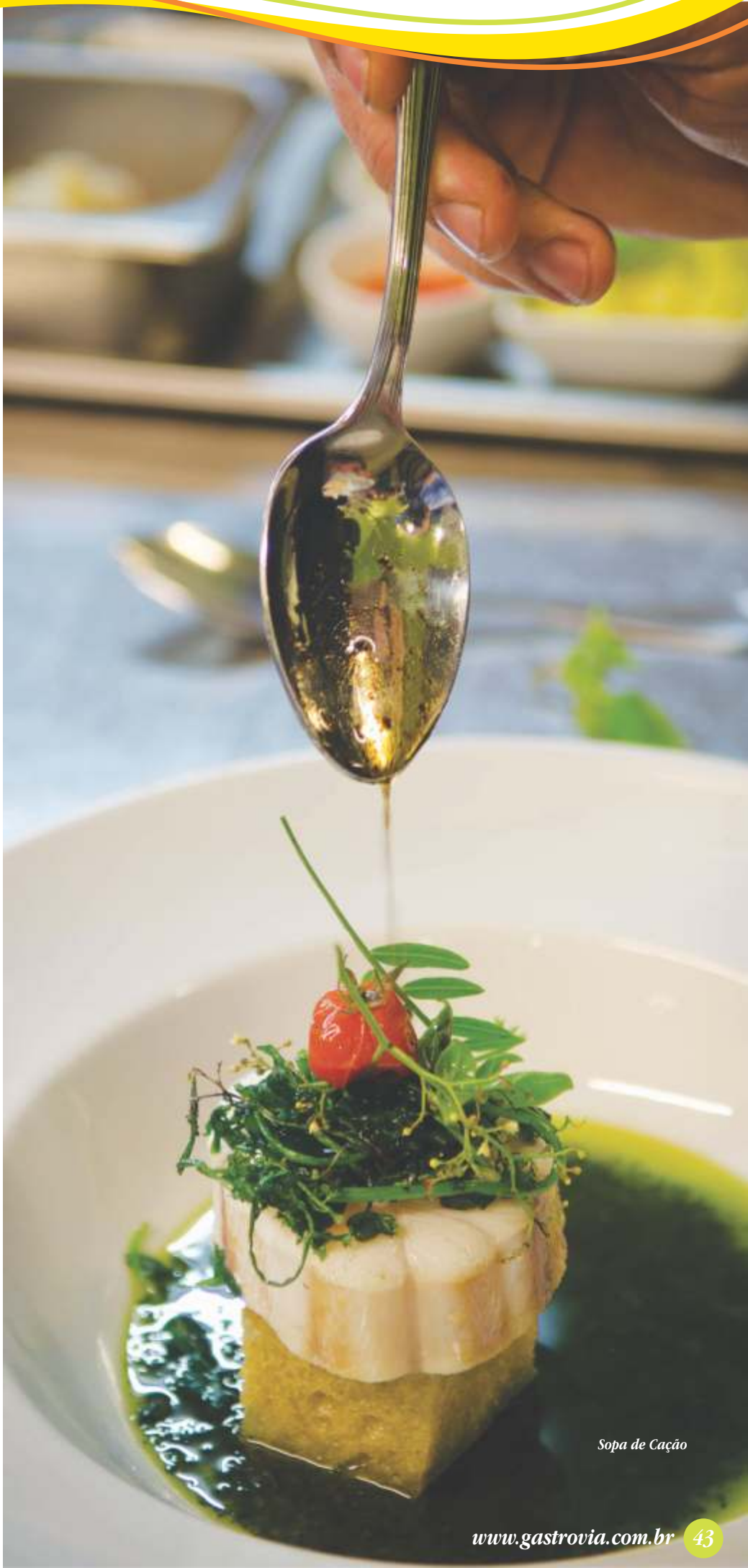
Sopa de Cação

Uma sugestão é o vinho português Reserva Esporão Branco, que vai muito bem com este prato.