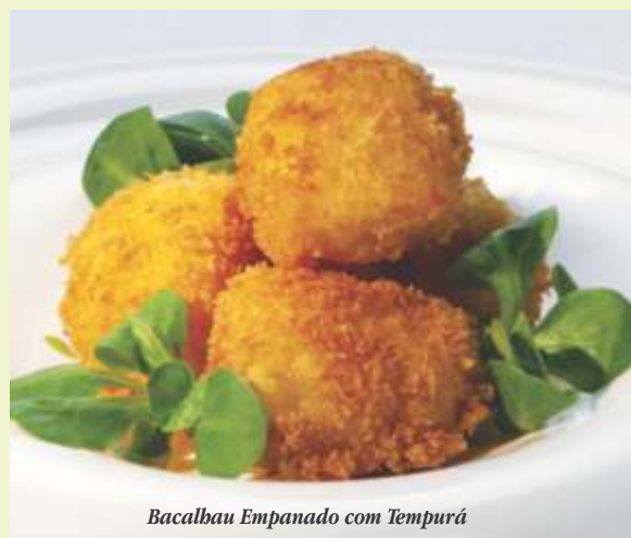
Bacalhau Empanado com Tempurá

Rendimento 4 porções Receita Bacalhau Dias