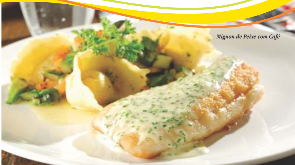
Mignon de Peixe com Café

Misture o suco de abacaxi adoçado, o café, o vinho branco e ferva por aproximadamente 5 minutos e reserve. Misture a manteiga com o azeite, o sal e a pimenta para temperar o peixe. Aplique este tempero em todo o peixe com a ajuda de um pincel de cozinha (feito de