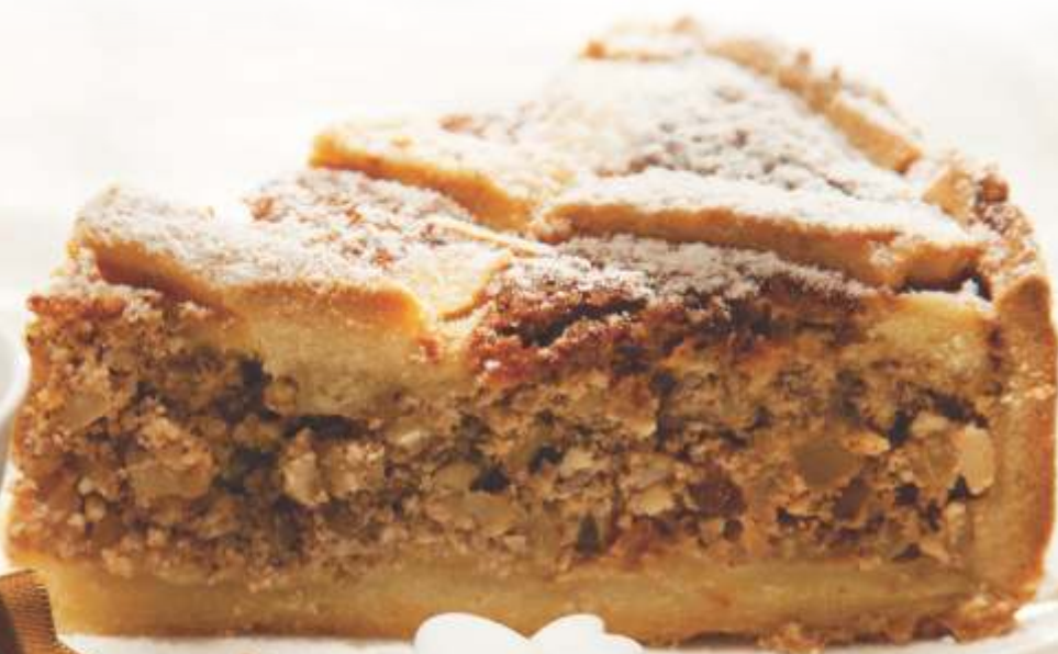
Torta Pastiera di Granno