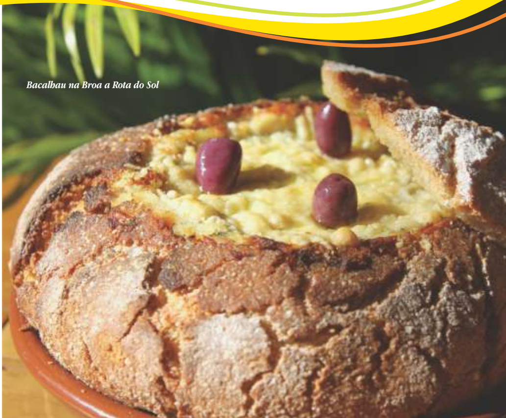
Bacalhau na Broa a Rota do Sol

(Porção para duas pessoas) Receita da Quinta da XV