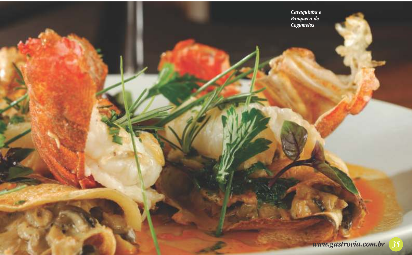
Cavaquinha e Panqueca de Cogumelos