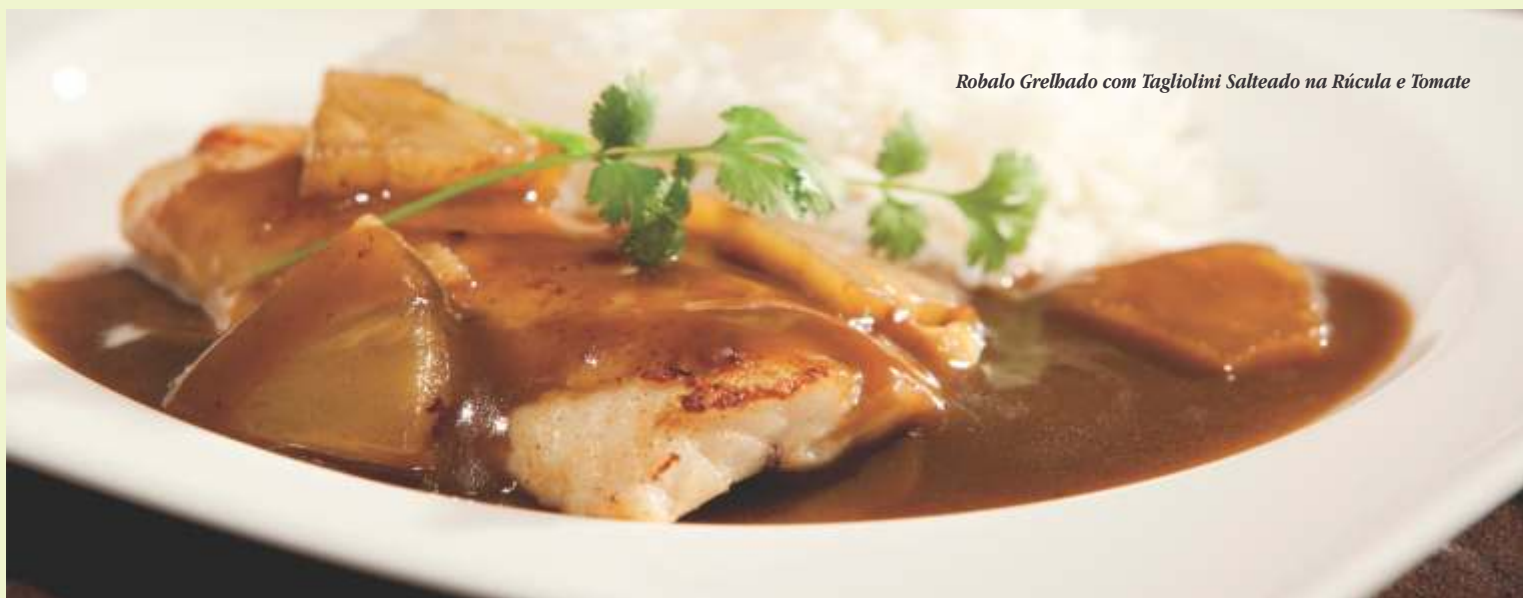
Robalo Grelhado com Tagliolini Salteado na Rúcula e Tomate