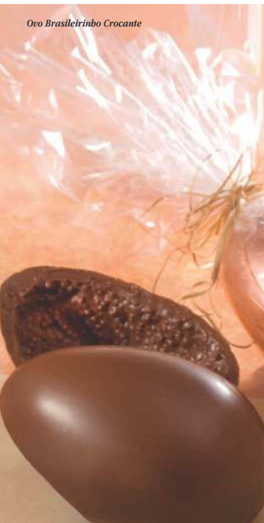
Ovo Brasileiro Crocante