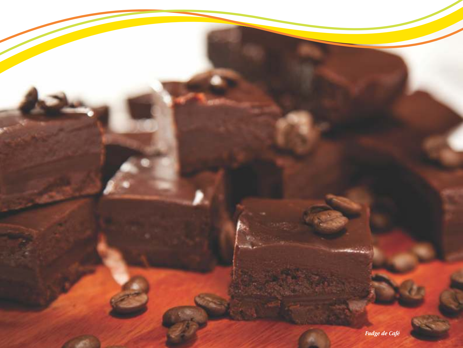
Fudge de Café