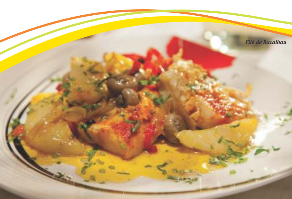
Filé de Bacalhau