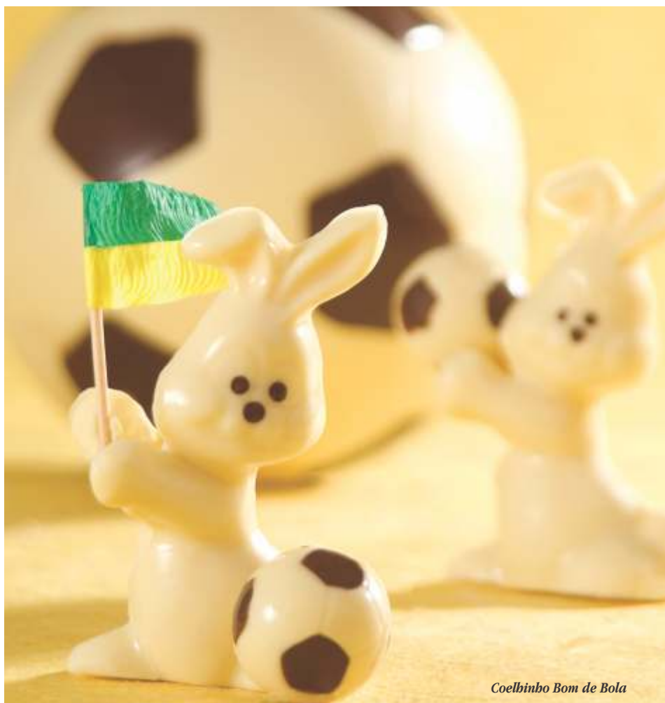
Coelhinho Bom de Bola

Pincele os olhinhos e o nariz do coelho e os pentágonos das bolinhas com o chocolate meio amargo temperado. Leve à geladeira por 2 minutos para secar. Preencha a forma de coelho com o chocolate branco temperado, só até as patinhas. Dê leves batidinhas para retirar o ar e leve à geladeira para secar por 15 a 20 minutos, ou até o molde ficar opaco e o coelhinho sair facilmente da forma. Preencha os moldes de bolinha com o chocolate branco e vire-os sobre dois refratários para escorrer o excesso. Dê batidinhas para eliminar as bolhas de ar e leve-os à geladeira por cerca de 5 minutos, virados sobre uma base com papel-manteiga. Retire-os da geladeira e preencha um dos moldes com a ganache de queijo e o outro com a goiabada (veja a receita ao lado). Cubra os moldes com chocolate branco temperado, limpe o excesso com uma espátula e leve à geladeira por 20 minutos, ou até que fiquem opacos e desenformem com facilidade.