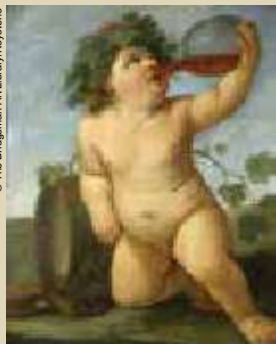
Guido Reni. O pequeno Baco, c. 1637-38. Óleo sobre tela, 72 cm x 56 cm. Gemaeldegalerie Alte Meister, Dresden, Alemanha.

Na Grécia Antiga cultuava-se um deus chamado Dionísio e em Roma um deus chamado Baco. Esses deuses, muito parecidos entre si, eram associados aos ciclos vitais da vida, às festas, ao vinho, à alegria.