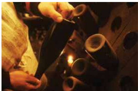
Processo de remuage.

Madame Clicquot, conhecida como Veuve (viúva em francês) Clicquot, foi quem aperfeiçoou tal técnica com a criação dos pupitres (suportes inclinados), os processos de remuage (para girar lentamente as garrafas) e de dégorgement (desobstrução, limpeza), a partir de 1814, transformando a bebida num líquido límpido.