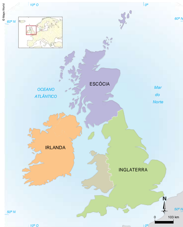
Fonte: BBC News. United Kingdom profile. BBC, 10 maio 2012. Disponível em: < http://www.bbc.co.uk/news/world-europe-18023389 >. Acesso em: 4 jun. 2012 (adaptado).

No ano de 1880, a Europa foi atingida por epidemias e diminuiu sua produção de vinho, obrigando os consumidores a procurar alternativas. Uma delas foi o uísque. Por ser destilado, era extremamente forte e caro, e, por isso, era misturado a vários tipos de uísque. A esse processo deu-se o nome de combinação ou blendagem . Hoje em dia, existem mais de 2 mil tipos de uísque escocês (Scotch).