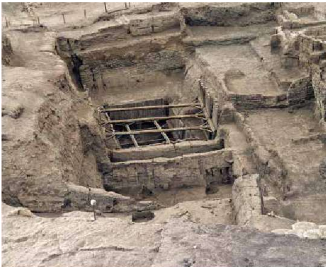
Catal Huyuk – cidade antiga localizada na atual Turquia, onde foi evidenciado o acúmulo de sementes de uva.

arqueólogo: Cientista que estuda culturas antigas a partir de objetos e materiais que os povos deixaram. O arqueólogo mais famoso dos filmes é o personagem Indiana Jones, que sai em busca de arcas, máscaras etc., a fim de decifrar particularidades dos antepassados.