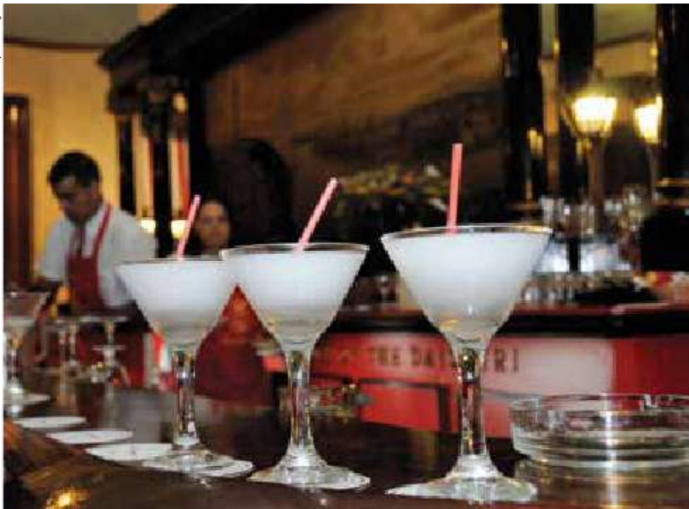
Balcão do bar Floridita, em Havana Velha, Cuba.

Essa bebida é muito conhecida por ter sido a preferida de Ernest Hemingway (1899-1961), famoso escritor estadunidense que viveu durante 20 anos em Cuba.